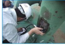
手动小面积容器腐蚀检测