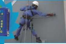
储罐焊缝手动TOFD检测