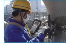
容器焊缝手动TOFD检测